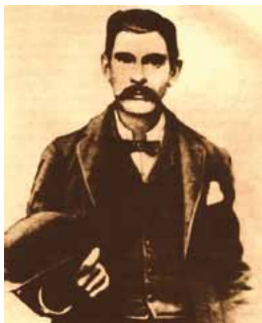
John Henry - "Doc" Holliday 6

U Međunarodnoj klasifikaciji bolesti DSM-IV i ICD-X, patološko je kockanje (312.3 vrs. F63.0 ili Z72. 6 -) kao jedna od šest kategorija svrstano u poglavlje "Poremećaji kontrole poriva" 7 . Ono sadrži bitno zajedničko obilježje te skupine poremećaja, a to je nemogućnost otpora porivu, nagonu ili iskušenju, odnosno, nesposobnost suzdržavanja od izvođenja čina koji je opasan ili šteti samoj toj osobi ili drugima. Ostali poremećaji u tom poglavlju su: F63.8 intermitentni